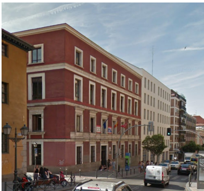
Edificio (de fachada roja) donde estuvo situada la Escuela Normal-Seminario Central de Maestros, en la calle de San Bernardo, número 80, de Madrid. Actualmente IES Lope de Vega.

Con la ayuda y la preparación de su prócer, don Joaquín Rivero, Don Sabino cursó por libre la carrera de Magisterio, en la que fuera la primera Escuela Normal del Reino, y superó brillantemente los exámenes que le otorgarían el título de Magisterio, expedido por la Escuela Normal-Seminario Central de Maestros Pablo Montesino, situada en la calle de San Bernardo, número 80, de Madrid, frente a la iglesia de Monserrat, en lo que antaño fuera un convento de monjas clarisas y que actualmente es el Instituto de Educación Secundaria Lope de Vega. Esta escuela de maestros, cuyo primer director fue Pablo Montesino, funcionó como tal desde el año 1839 al 1995.