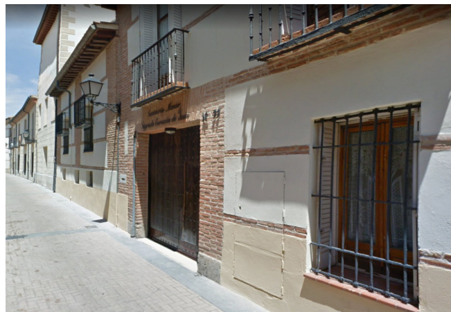
Fachada del Seminario Menor de Alcalá de Henares (Madrid).