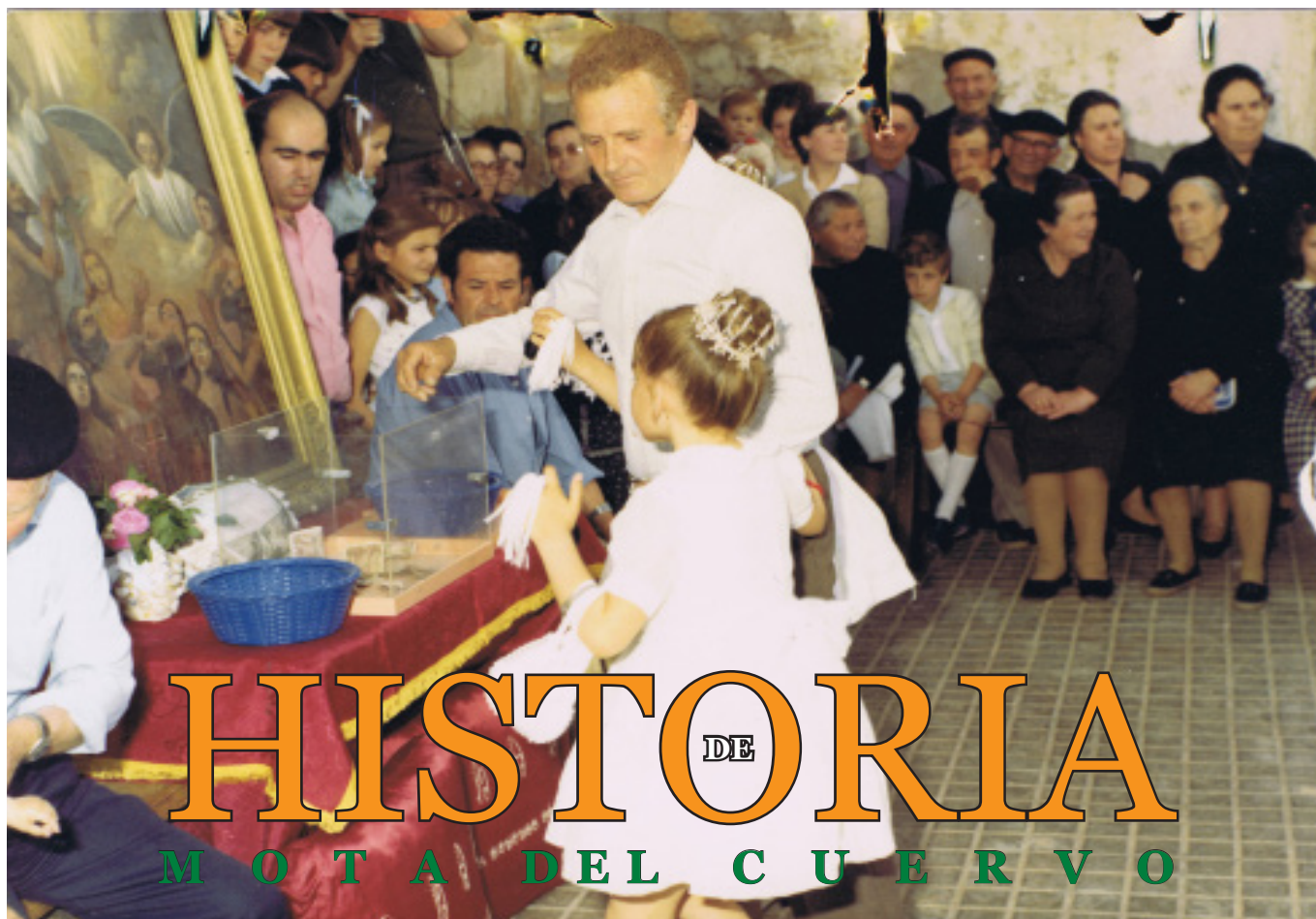
Función de Ánimas del año 1982.