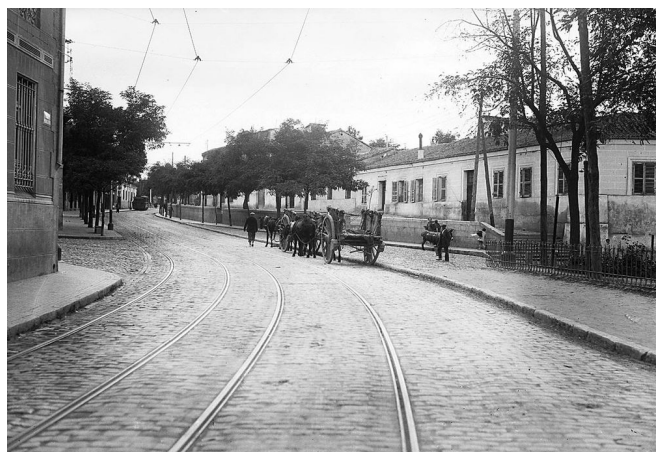
Calle de Eugenia de Montijo, Carabanchel Alto, en 1926.

Don Sabino estudió en el Seminario Menor de Alcalá de Henares, de aquí que dominara tan bien el latín. A los pocos años abandonó los estudios eclesiásticos, y