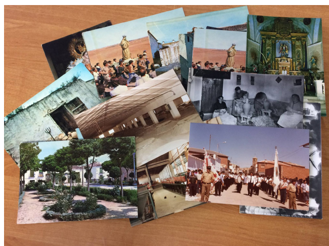
Algunas fotos Antiguas llegadas a la Asociación

No dejéis de enviarnos más fotografías antiguas sobre Mota del Cuervo, porque continuaremos con la segunda parte pronto.