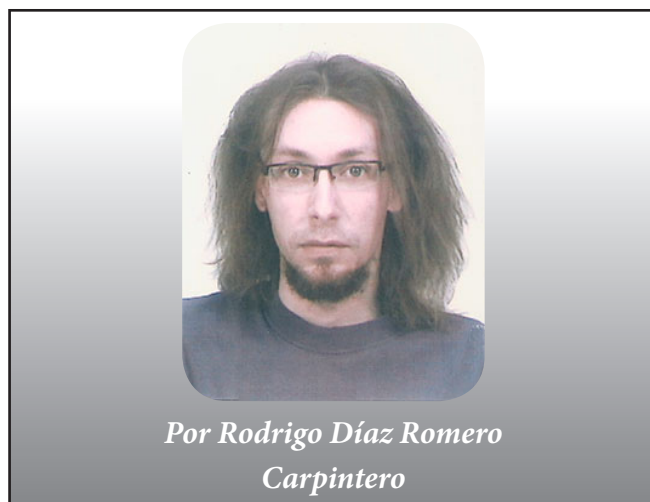
Por Rodrigo Díaz Romero Carpintero