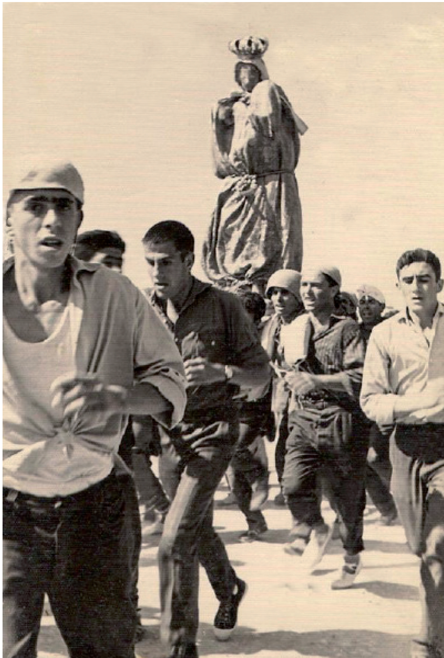
Traída de la Virgen de Manjavacas, año 1962