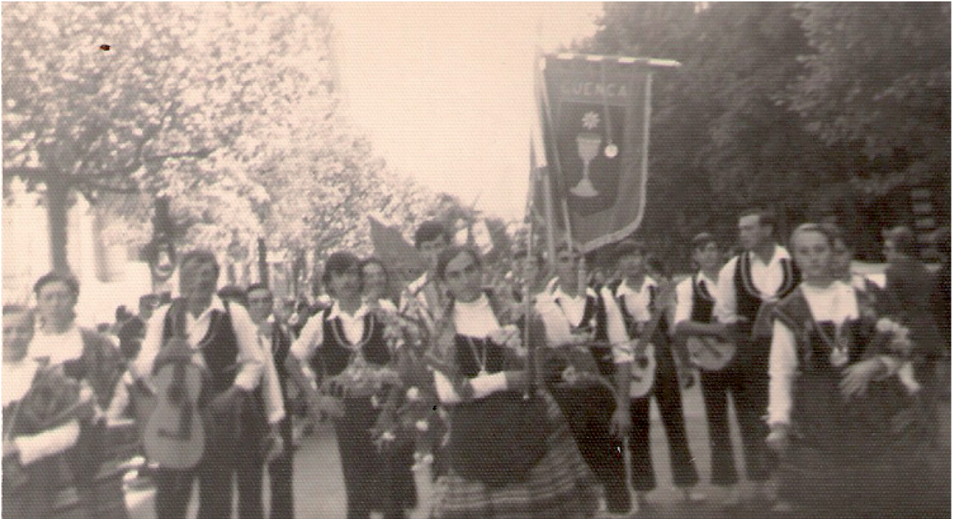
Grupo folclórico de Mota del Cuervo, Zaragoza, año 1974

Si hay una cosa grande en la Mota, con la que cualquier moteño esté identificado, no es nada más y nada menos que nuestra Patrona, la Virgen de Manjavacas. Es una figura que nos acompaña a todos, creyentes y no creyentes, en todos los días de vuestra vida, pues está en nuestra identidad moteña.