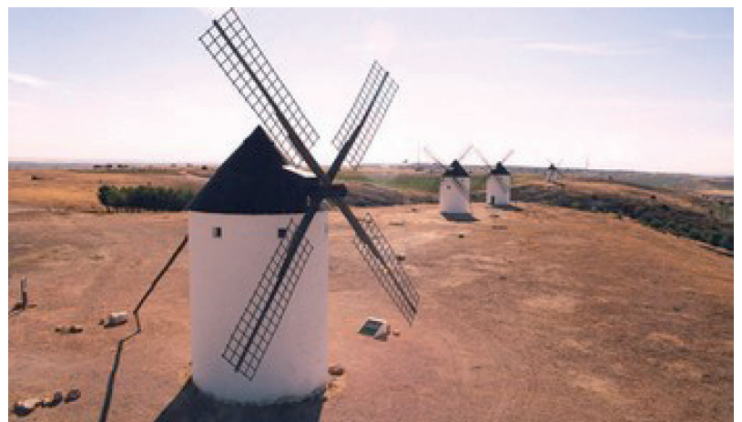
Molinos de Mota del Cuervo

Molino que estás moliendo el trigo con tanto afán, ¡tú estás haciendo la harina, y otros se comen el pan!