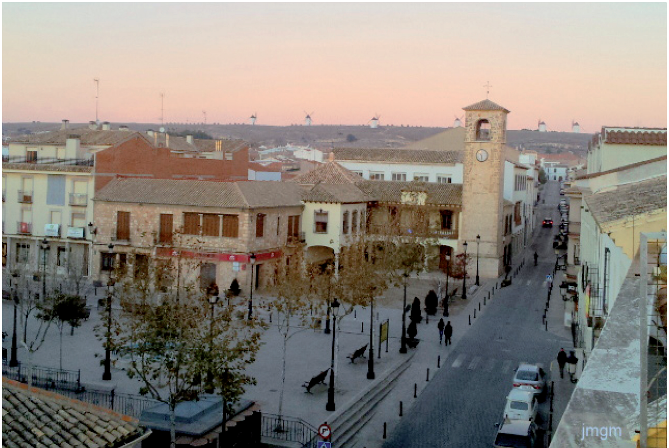
Calle Mayor de Mota del Cuervo.