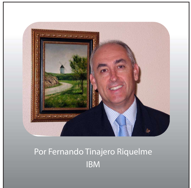
Por Fernando Tinajero Riquelme IBM