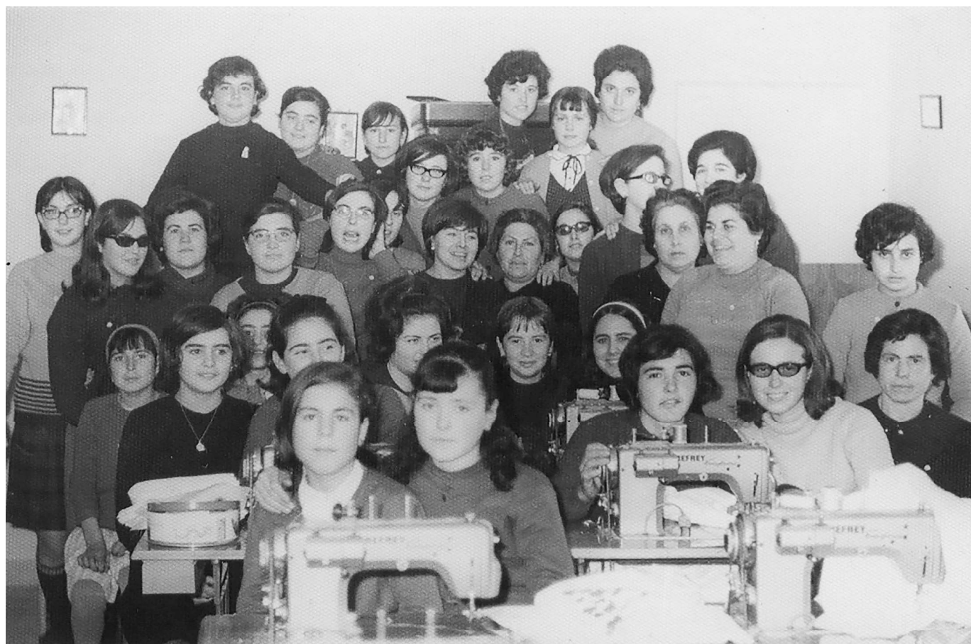
Taller de costura, año 1966.