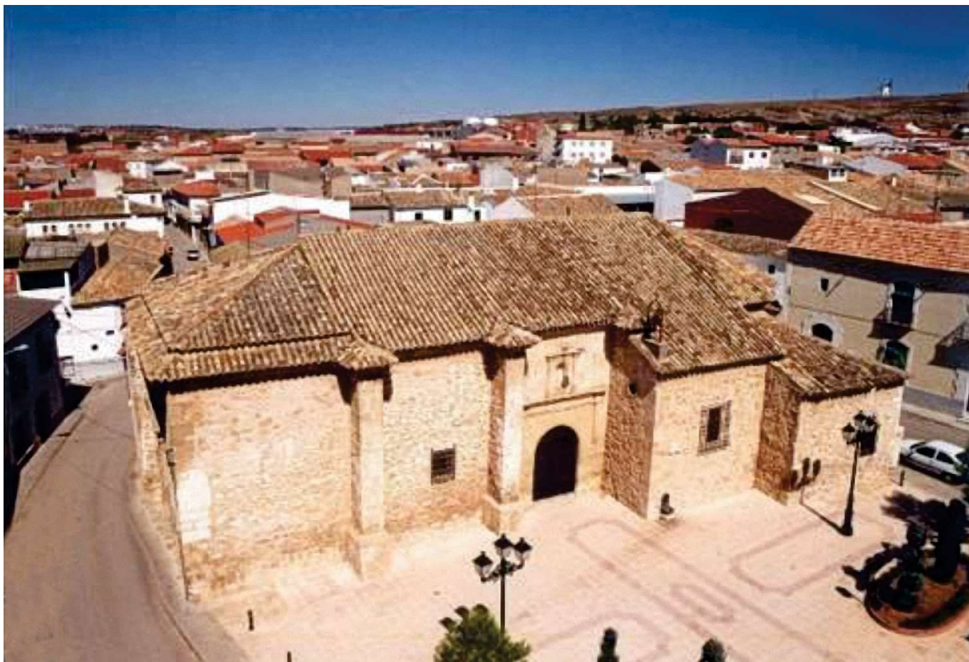
Vista aérea de la ermita de San Sebastián

Por estas fechas, más o menos, se construyeron ermitas a todo lo largo y ancho de la Mancha: en Villamayor de Santiago, Quintanar de la Orden, Campo de Criptana, Villanueva de Alcardete, Corral de Almaguer, Pedro Muñoz, El Toboso y la Mota del Cuervo, entre otros.