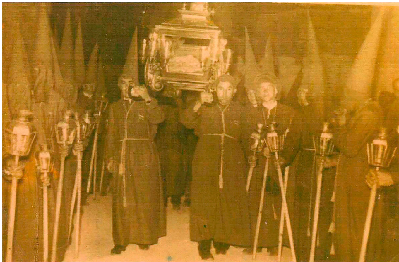
Procesión de Viernes Santo con el Santo Sepulcro. Años sesenta del siglo xx