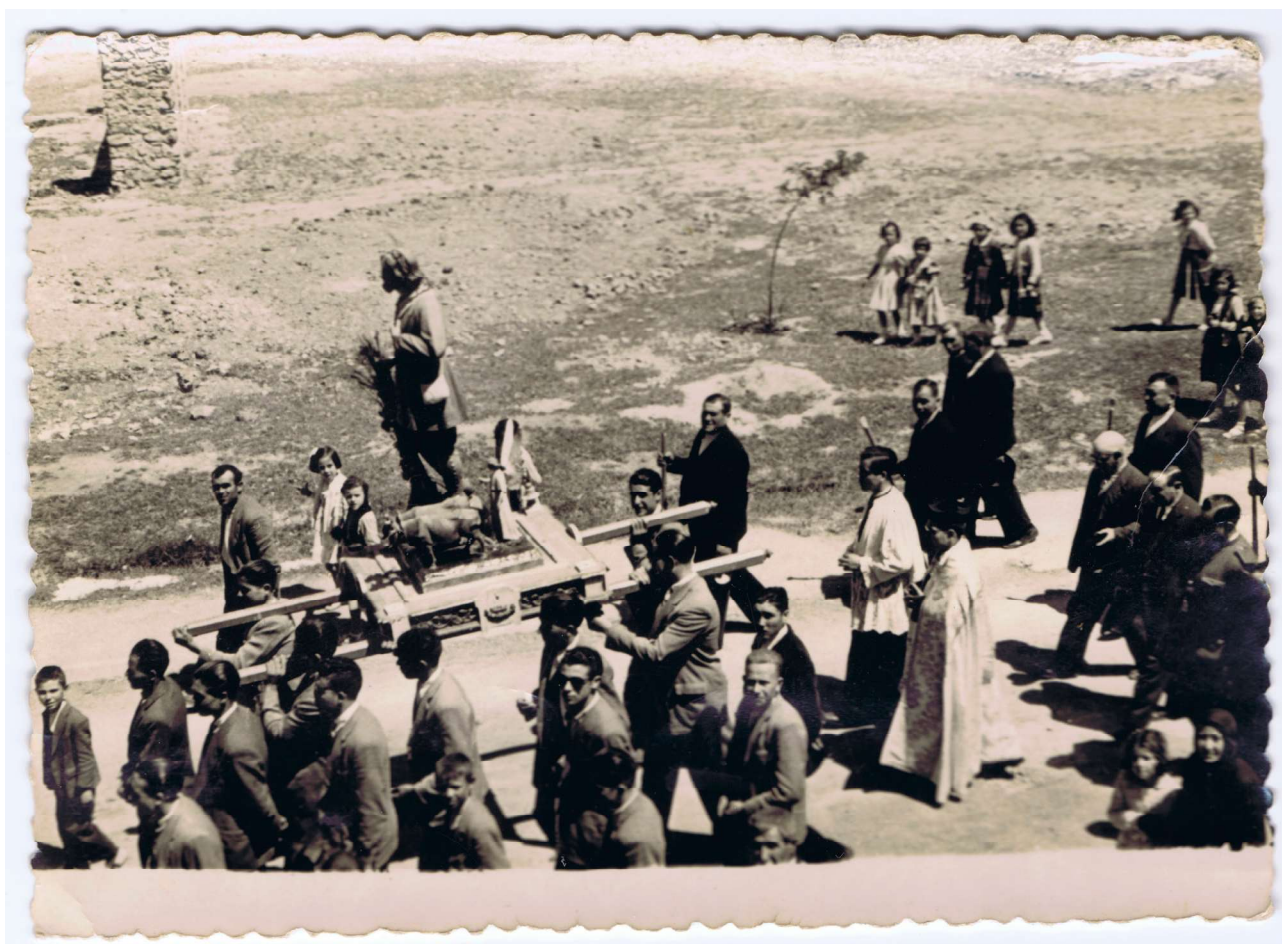
Procesión de San Isidro, década de 1960.