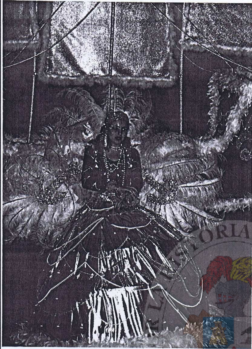
DAMA DEL CARNAVAL DE LA COMPARSA MALABRIGO