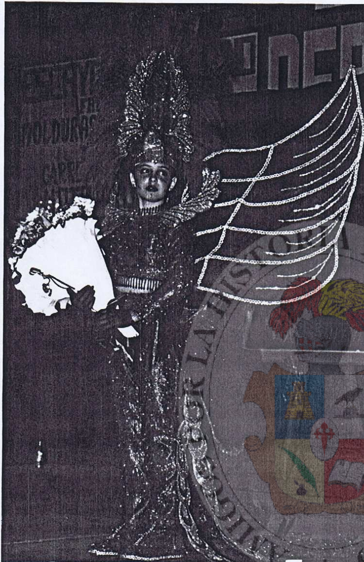
REINA INFANTIL DE LA COMPARSA LOS PEQUEÑECES