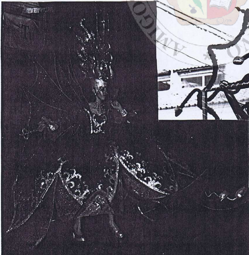
DAMA DEL CARNAVAL DE LA COMPARSA L.G.N. ADN DEMENTES