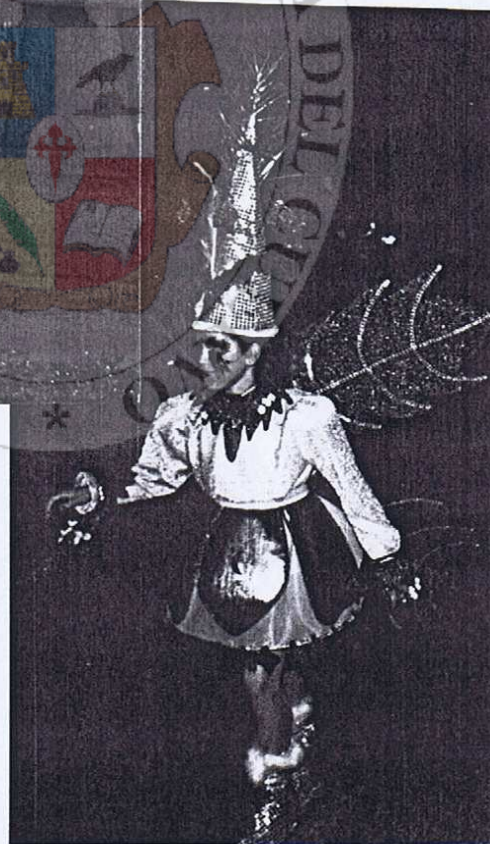
DAMA INFANTIL DE LA COMPARSA LOS DIMINUTOS