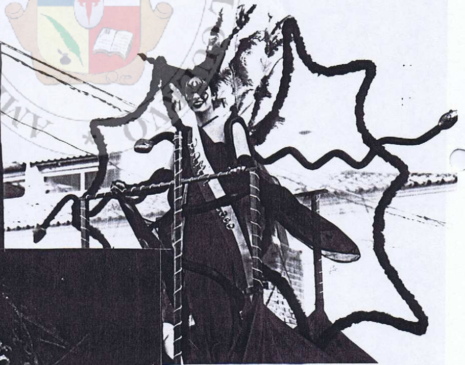
DAMA DEL CARNAVAL DE LA COMPARSA ANDRES SEGOVIA